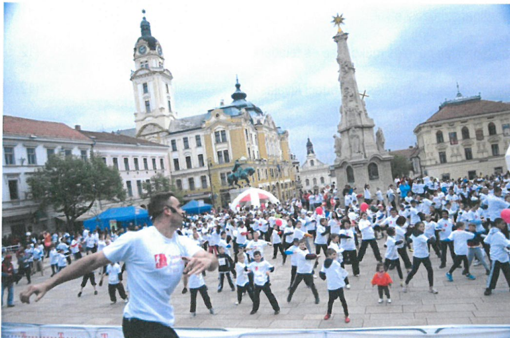
Vivicitá Városvédő futás 2013., Pécs, Belváros, 2100 résztvevő